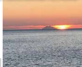
Riviera dei tramonti